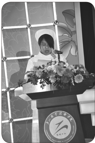
▲ 学习雷锋先进个人代表发言