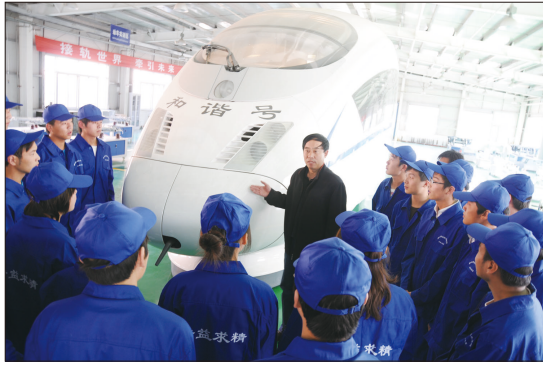
动车组技术专业校内实践教学

我们希望通过这次教育成果展示活动，进一步推动学院内涵建设，扩大人才培养和社会服务工作的影响，不断提高教育工作的质量和水平。