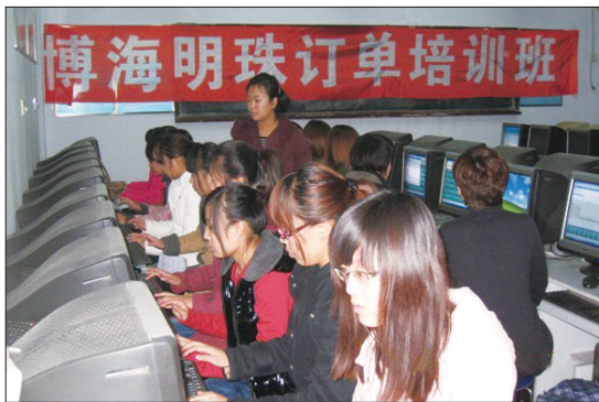
财经系与渤海明珠大酒店签订订单培养协议