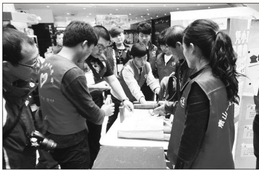
学生在社会上的良好公益形象。

庭奉献爱心。针对有的市民对这项活动的怀疑态度,志愿者们耐心地一一详细解释。通过此次活,志愿者们不仅展现出自身的服务热情,奉献了爱心,也树立了我院