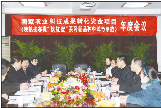
农林工程系承担国家农业科技成果转化项目