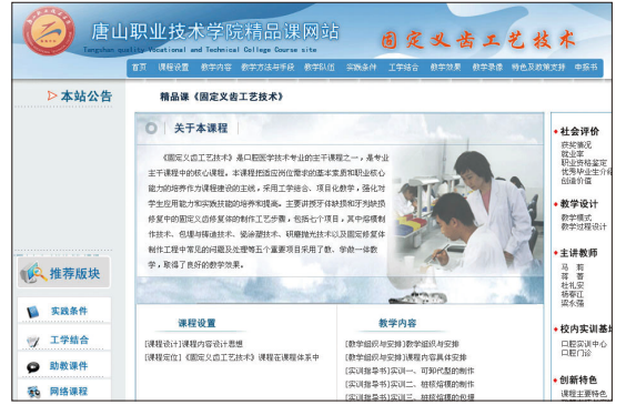
口腔系《固定义齿工艺技术》被评为国家级精品课