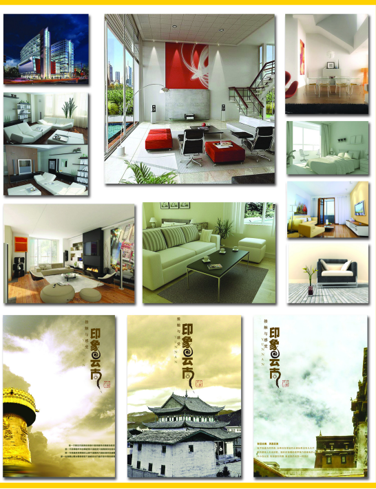
信息工程系艺术类专业学生作品