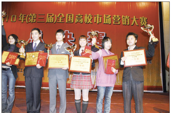
管理系团队荣获全国市场营销大赛一等奖