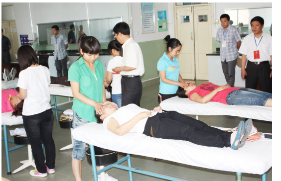
继续教育学院组织保健按摩师考试