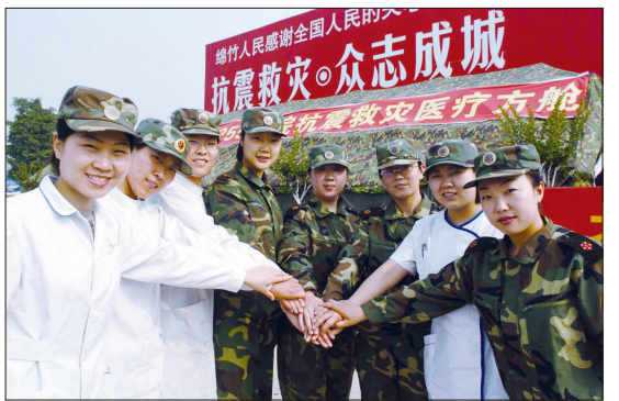
护理专业毕业生组成“八姐妹”战斗小组赴四川汶川抗震救灾