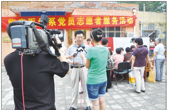
临床医学系开展志愿服务进社区活动